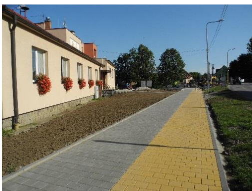
smíšený chodník pro chodce a cyklisty-KD