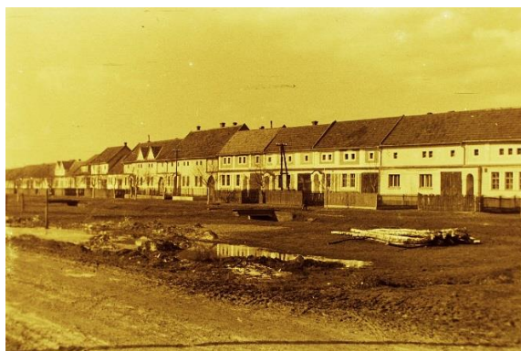
Výstavba na Malé straně, po roce 1920

Název obce je podle odborného dialektologa Rudolfa Šrámka odvozen od osobního jména Šuma, to znamená ze slovesného základu šuměti . Přípona -ice zdůrazňovala, že běží o ves lidí Šumových, tzn. náležejících Šumovi.