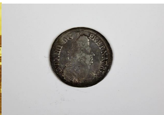
mince , nález z obce Šumice