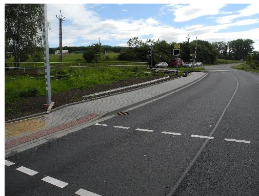
přechod železnice a silnice II/495 u železničního přejezdu-východ obce