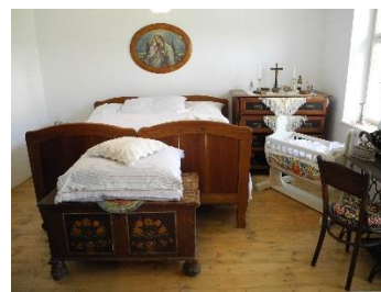
Rekonstrukce lidové stavby čp.102 na obecní muzeum, společenské prostory