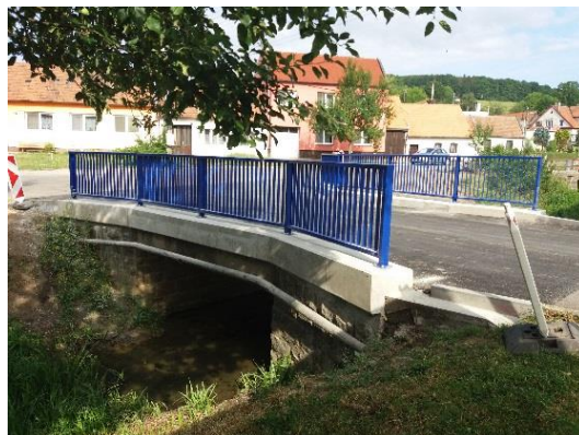
oprava mostu přes Ovčírku – Kút