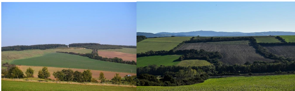
Typická krajina obce Šumice, pole a louky rozdělují spádnice s porostem - hráze