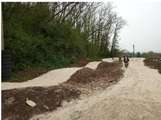
bikrosová dráha, hřiště SKALKA/SDH